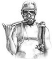
Go that way