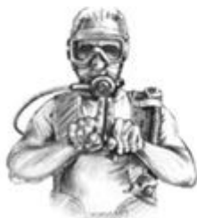
Get with your buddy