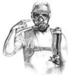
Ears won't clear